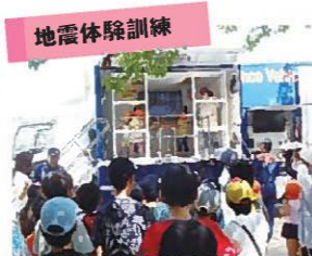
地震体験車により、地震の揺れの怖さを体験して、地震に備える大切さを学ぶ訓練