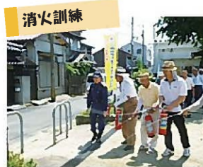
水消火器を使った消火訓練