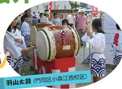
羽山太鼓 (門司区小森江西校区)

自治会・町内会では、地域の伝統行事の継承や、お祭り等の親睦活動にも取り組んでいます。