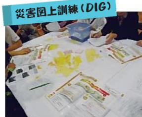
地域の地図を使い、危険な場所などを地図に書き込んでいく訓練