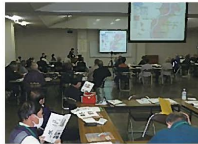
地域の現状や課題などの意見交換を行いました