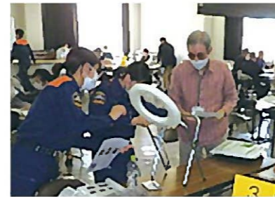
防災グッズや簡易トイレを作成しました