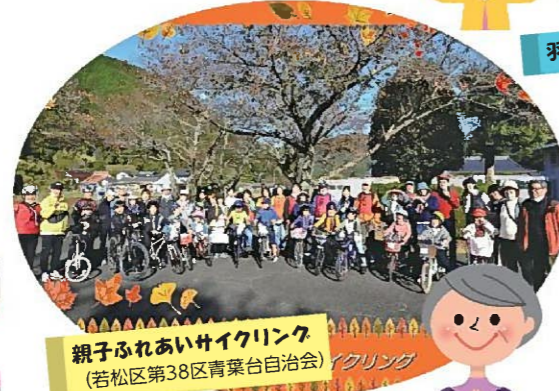
親子ふれあいサイクリング (若松区第38区青葉台自治会)