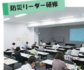
地域の防災リーダーを育成するための研修会

北九州市市民防災会総連合会 【お問い合わせ】〒803-8509 北九州市小倉北区大手町3番9号(北九州市消防局 予防課内) TEL:093-582-3836