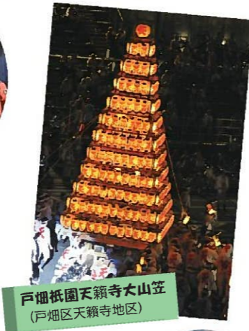
戸畑祇園天籟寺大山笠 (戸畑区天籟寺地区)