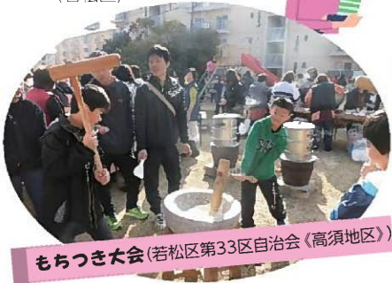
もちつき大会 (若松区第33区自治会〈高須地区〉)